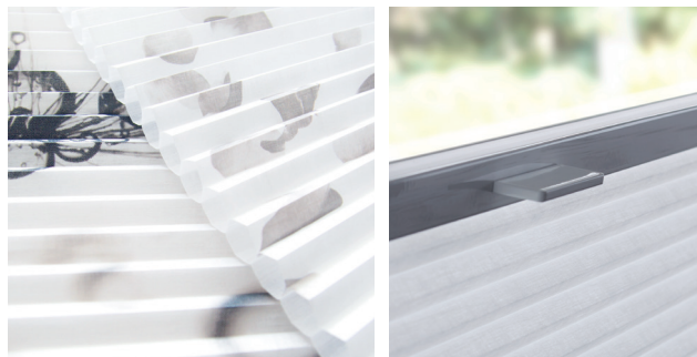
Structure en nid d'abeilles

Les stores plissés nid d'abeilles ATES/MHZ allient fonctionnalité, esthétique et perfection technique.