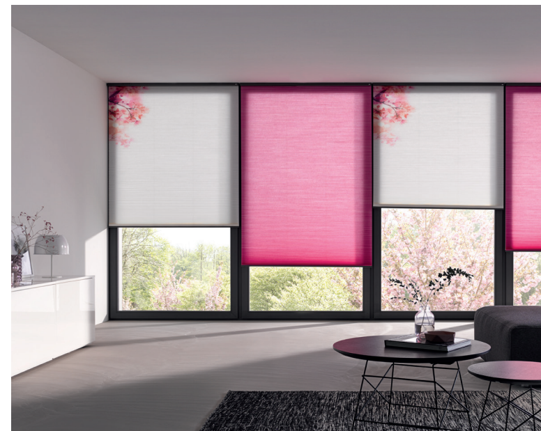
Les nouveaux stores plissés nid d'abeilles ATES/MHZ

11 PNA 0817 F - Sous réserve de modifications techniques - Photos et illustrations non contractuelles