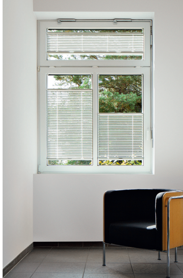
Store vénitien ATES/MHZ TwinLine - pose avec set pour fixation adhésive