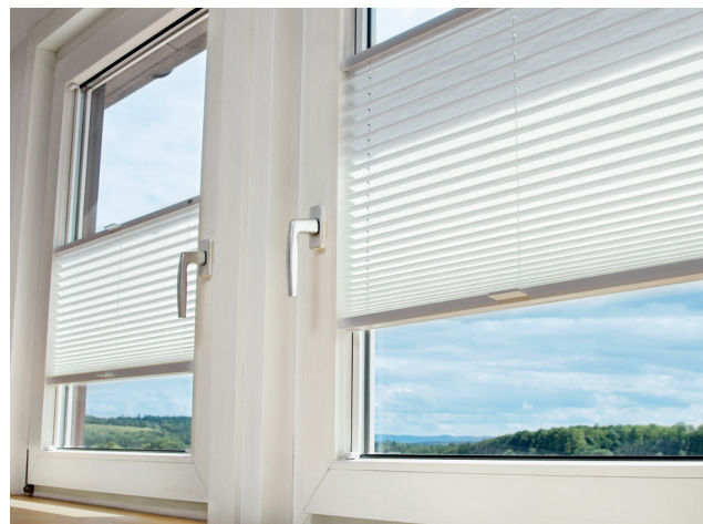
Store plissé ATES/MHZ 11-8220 - pose avec set pour fixation adhésive