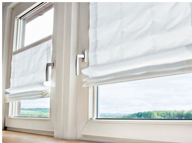
Store bateau ATES/MHZ AREO - pose avec set pour fixation adhésive